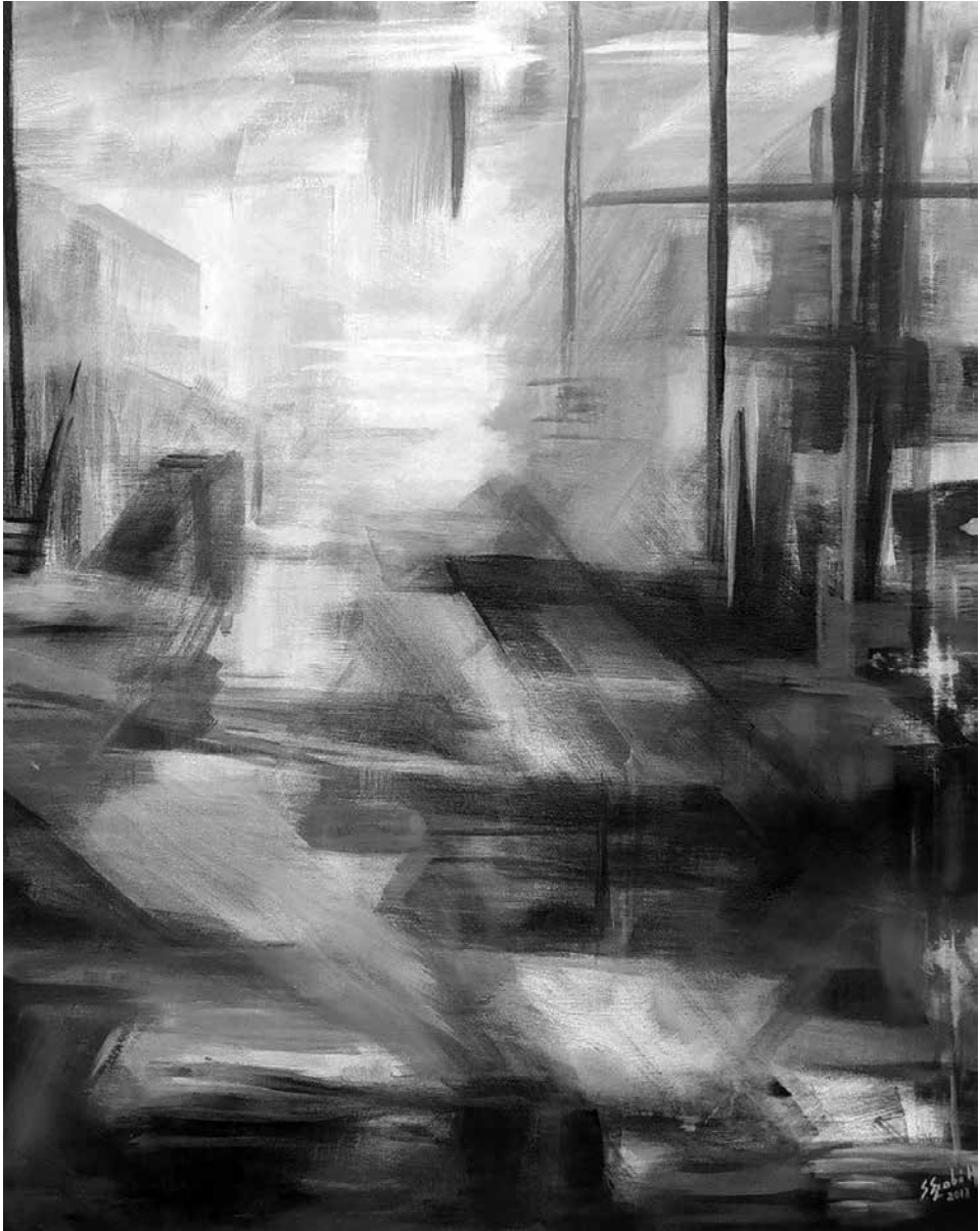
Hajnali villódzás, 2018