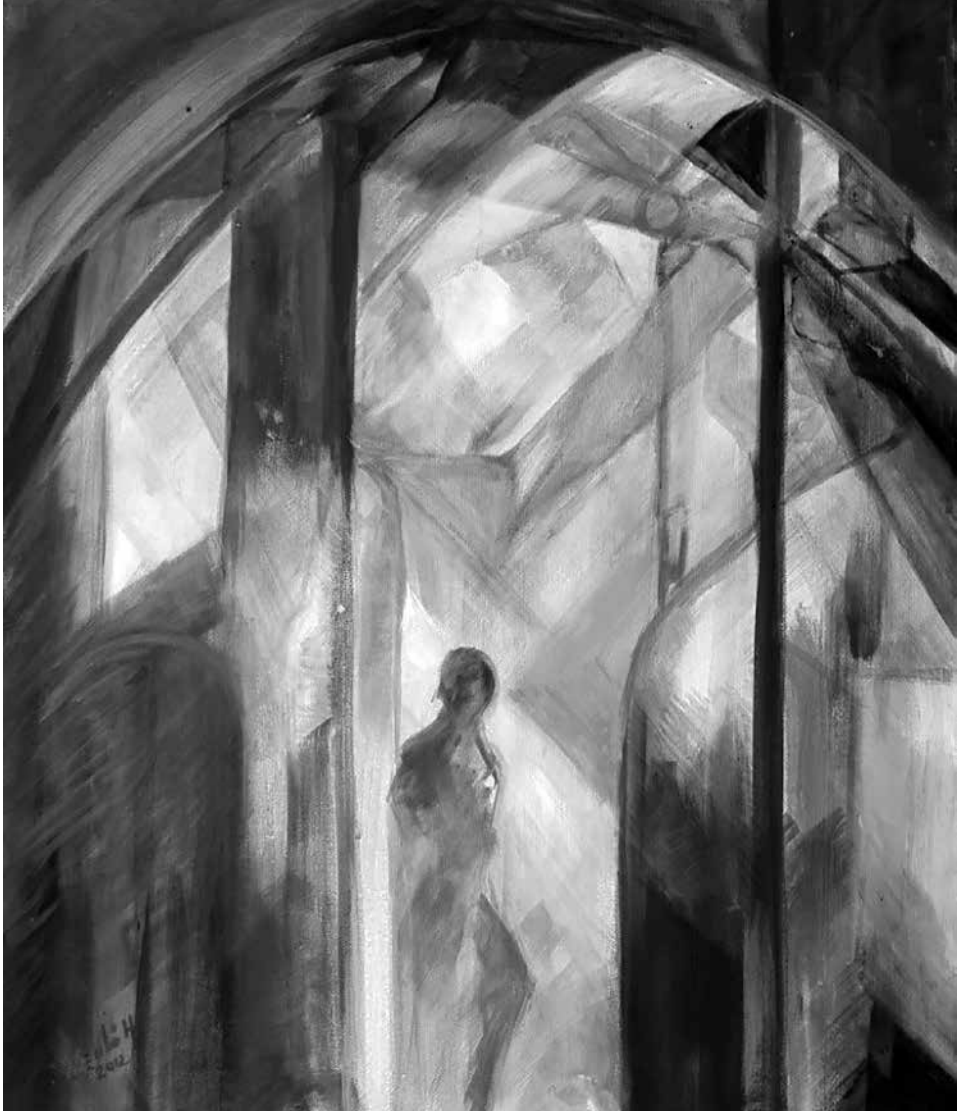
A gótika fényei, 2012