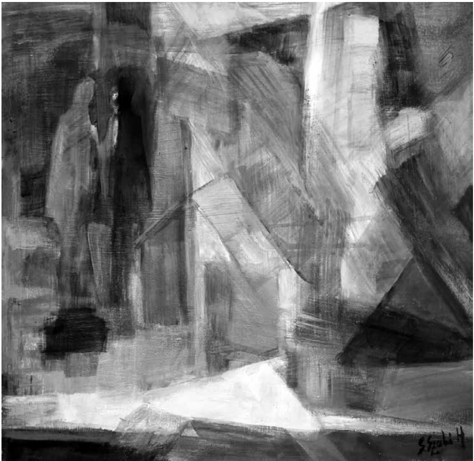
Az Iparosok utcájában, 2023