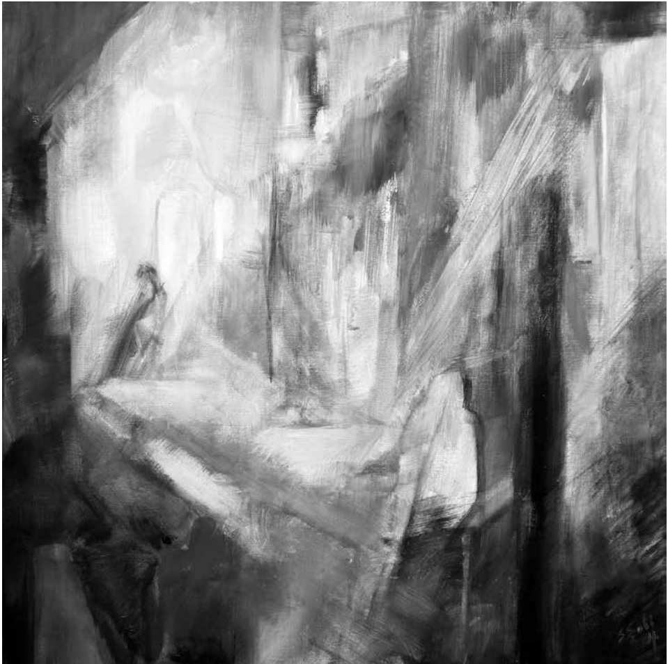
Antik hangulat, 2023

kérdezte: „Tényleg itt vagy, vagy valahol másutt?” Rav kezei feltáncoltak, tördelték a szót, arca tüzelt, negyedóra türelmet kér, s amint bólintás jelezte, hogy megértették, kutyával a nyomában visszafelé ügetett a bátyhoz.