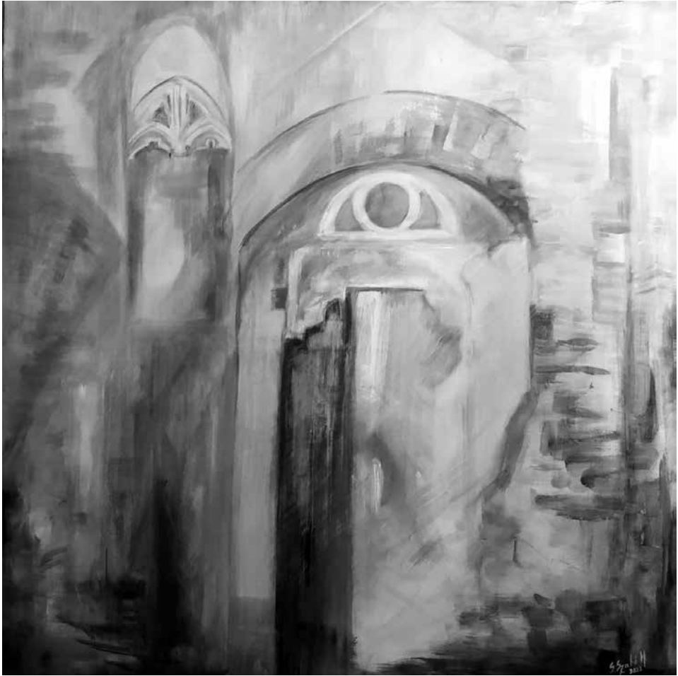
A múlt fénye, 2022