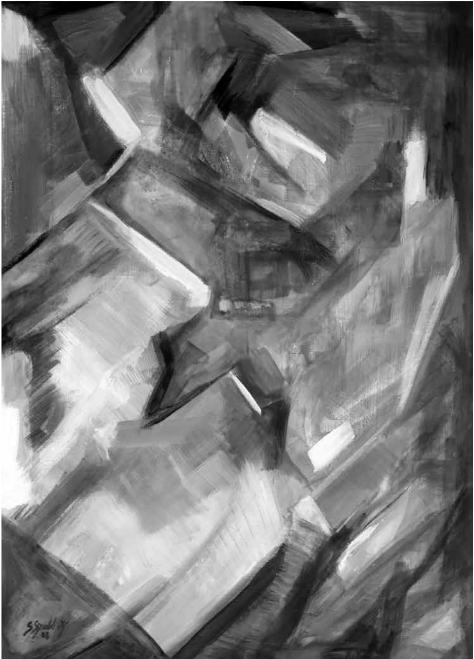
Fényjáték I., 2008