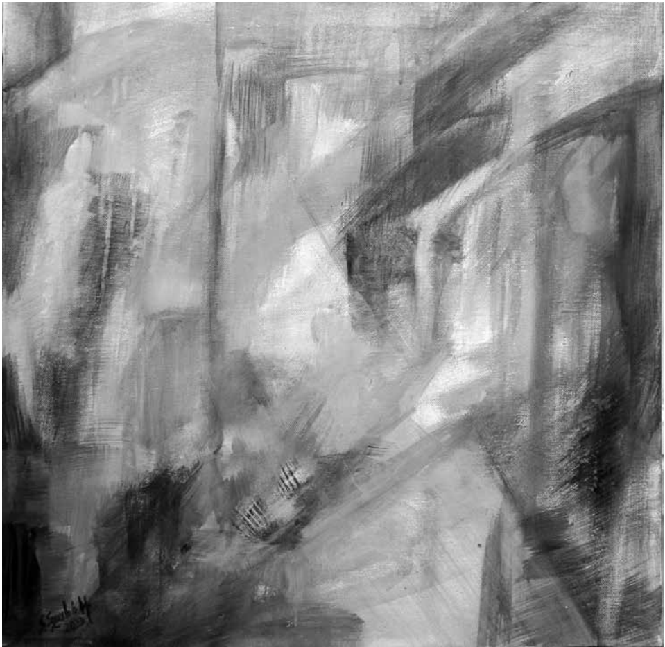
Mediterrán emlék, 2023