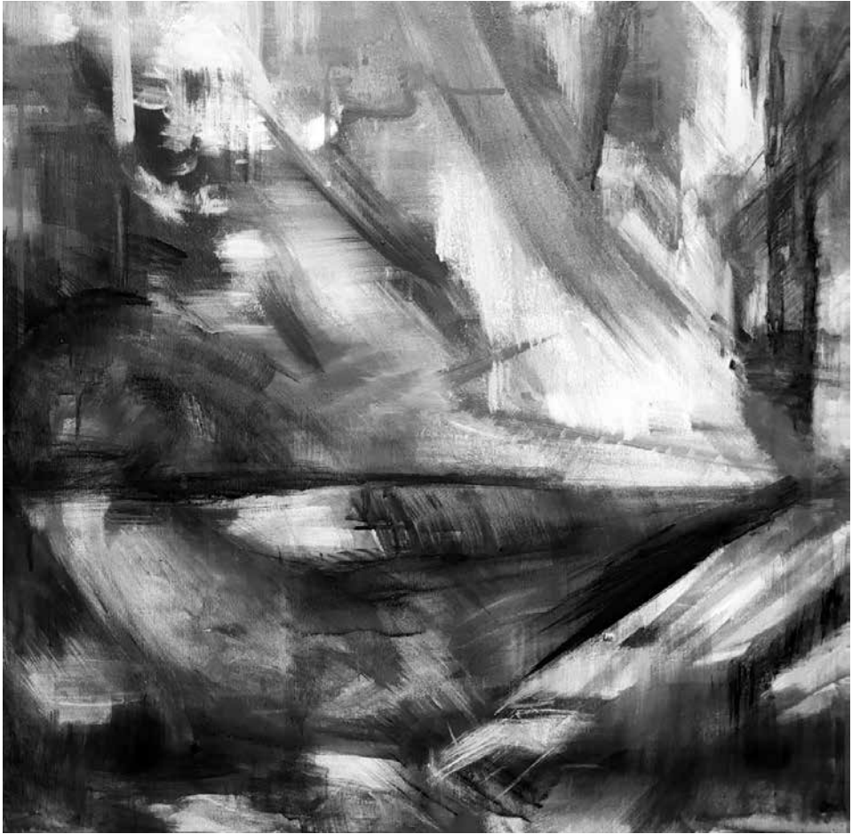
Fényár a parkban, 2022