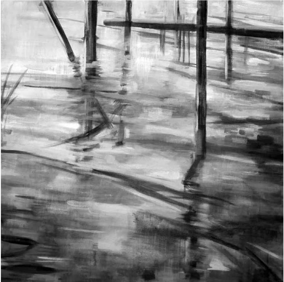
Hajnali nyugalom, 2012